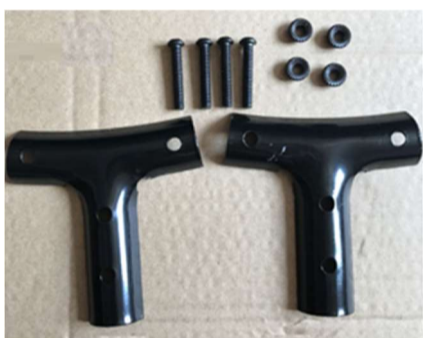
Staffe, viti, dadi (Fig. 3)

La spina deve essere scollegata dalla presa per effettuare le operazioni di assemblaggio. Se necessario, farsi aiutare da una seconda persona.