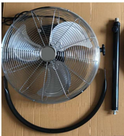
Corpo motore, ghiera in plastica, fusto (Fig. 1)