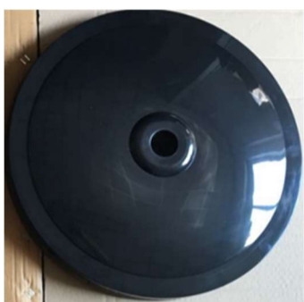
Base rotonda (Fig. 2)